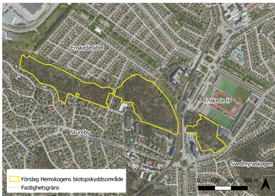
Figur 3. Översikt över föreslaget Hemsborgens biotopskyddsområde.

Avgränsning har skett både med hänsyn till områdes naturvärden samt pågående och framtida bebyggelseutveckling. Vid inmätning av gränsen i fält att hänsyn tagits så att underhåll av angränsande byggnader, anläggningar och vägar inte försvåras.