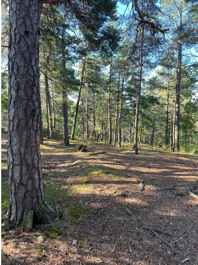
Figur 2. I Hemskogen finns många gamla tallar.